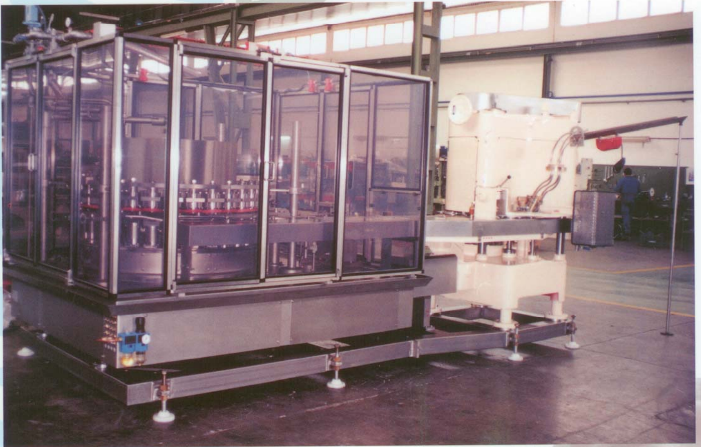
FMC 652 & FMC XLV30