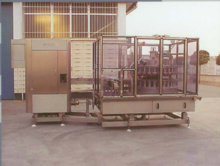
ANGELUS 61 H & FMC XLV30