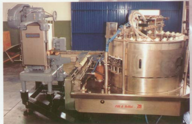
ANGELUS 60L & Z-B R32