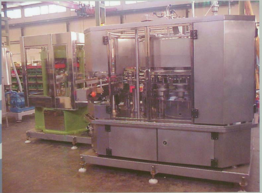
COMACO AGM/3 & RS15