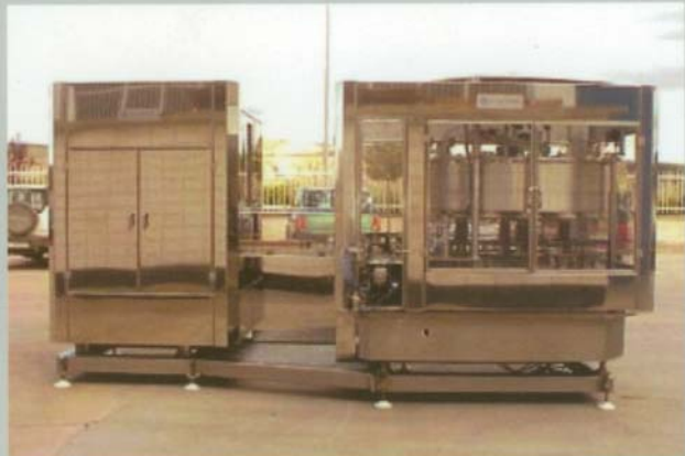
ANGELUS 59P & Z-B R15