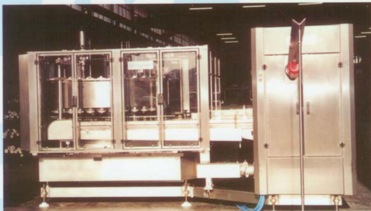
ANGELUS 60L & ZILLI-BELLINI R32