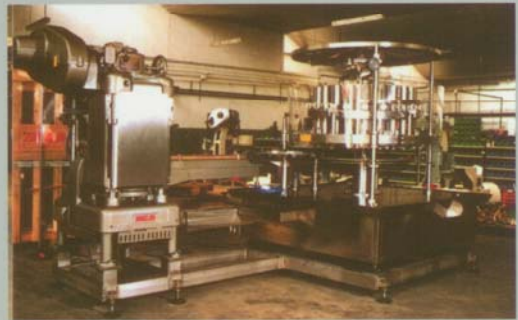
ANGELUS 60L & ZILLI-BELLINI DB24