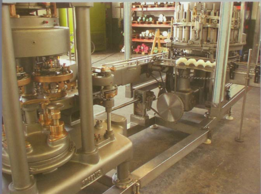
ANGELUS 40P & PFAUDLER RP21