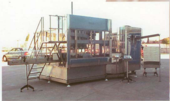
FMC 752 & MUPECK-UFRT