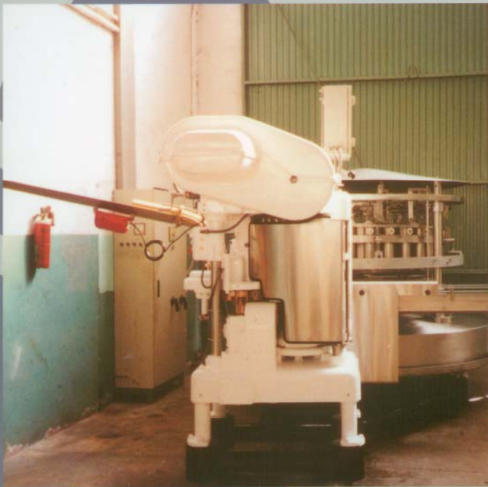
ANGELUS 60L & STORK 27 P