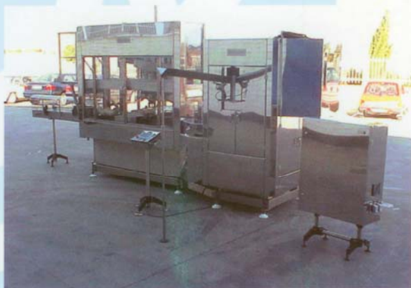
FMC 752 & MUPECK-UFRT